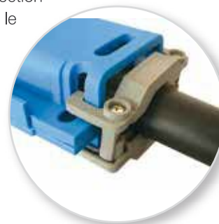
TABLEAUX DE CONFIGURATION

Boîte de jonction droite pour câbles de 0,6 / 1 kV jusqu'à cinq conducteurs et section du câble traversant allant jusqu'à 25 mm 2 . Le kit de armure fournis, permet le raccordement aussi avec câbles armés. Le bornier à cinq phases fourni permet une double isolation et avec le system de décharge de traction de câble, permet le blocage du câble à l'intérieur de la boîte de jonction.