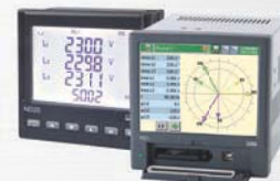
Power network meters ND20 and ND1 type.